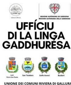
UNIONE DEI COMUNI RIVIERA DI GALLURA