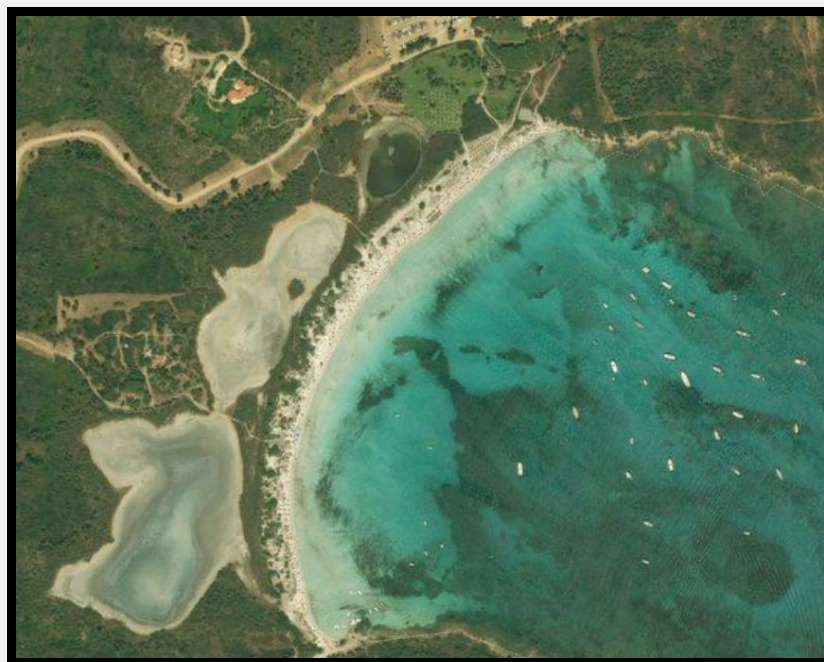
Arenile di Cala Brandinchi

Gli operatori impiegati nei varchi di accesso dovranno essere supportati giornalmente dagli operatori impiegati nelle attività di sensibilizzazione all'uso consapevole degli arenili, durante le ore di maggior afflusso agli arenili , al fine di garantire una maggiore e più celere fruibilità degli accessi.