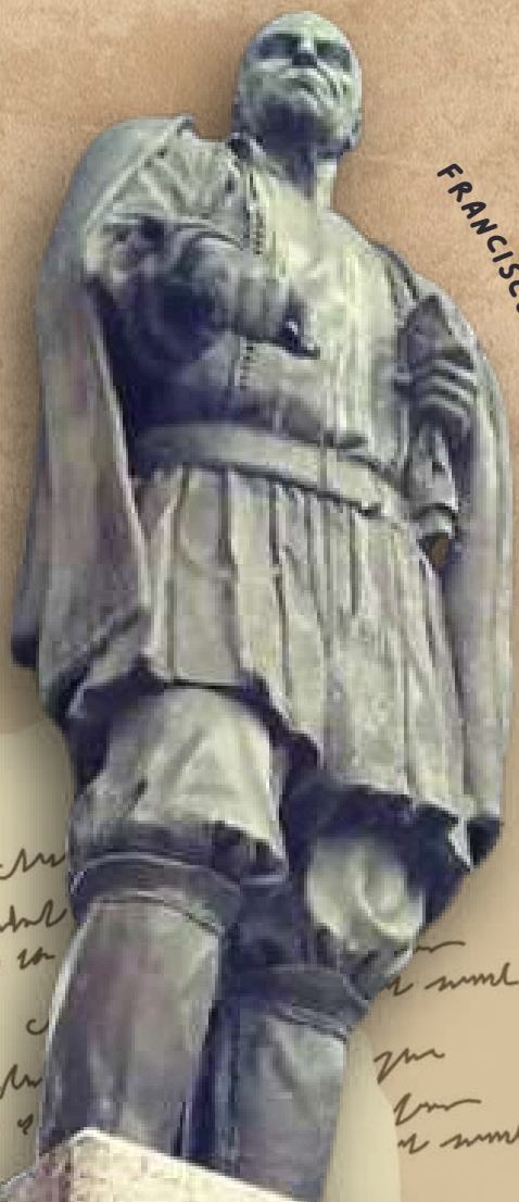
FRANCISCU IGNAZIU MANNU