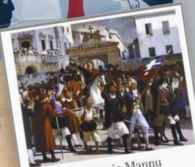
Francesco Ignazio Mannu Su patriota sardu a sos feudatarios a cura di Luciano Carta