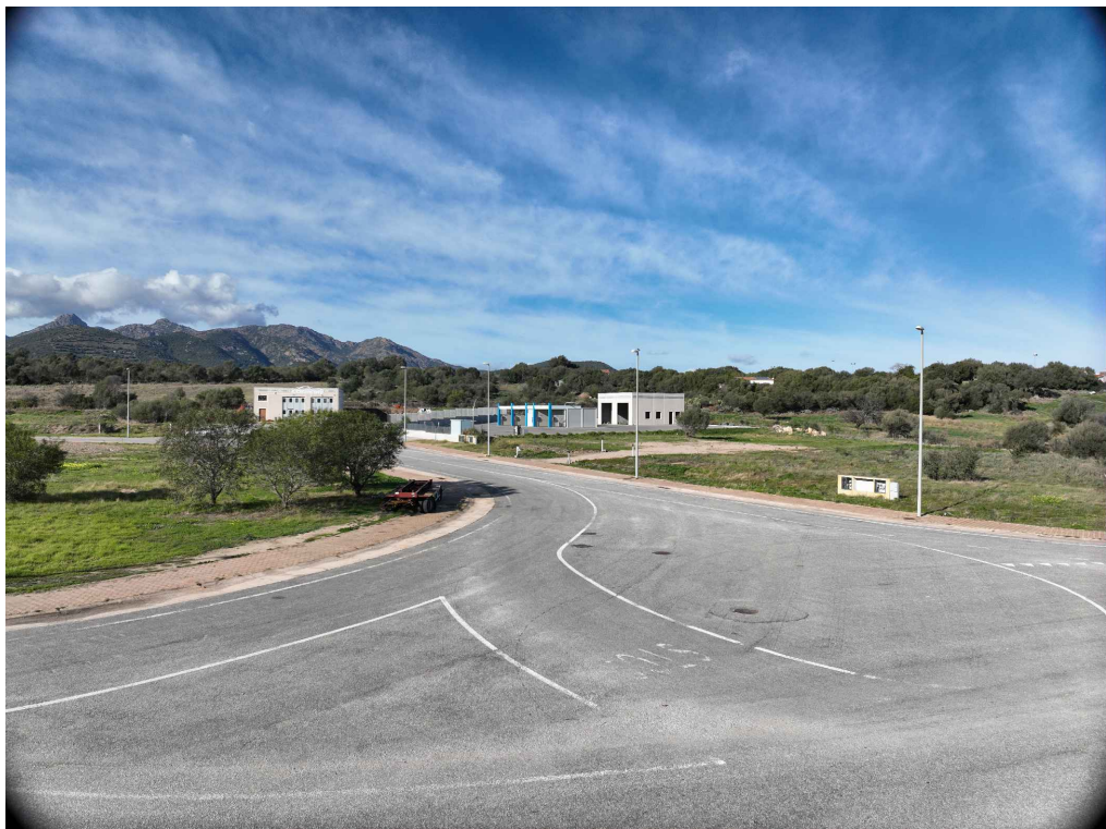
01 - Inquadratura telecamera