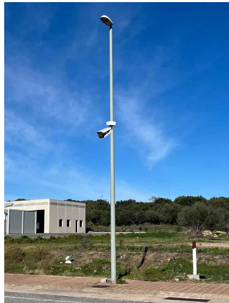
02 - posizionamento telecamera