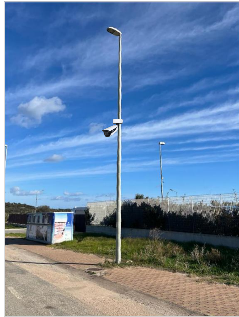
01 - posizionamento telecamera