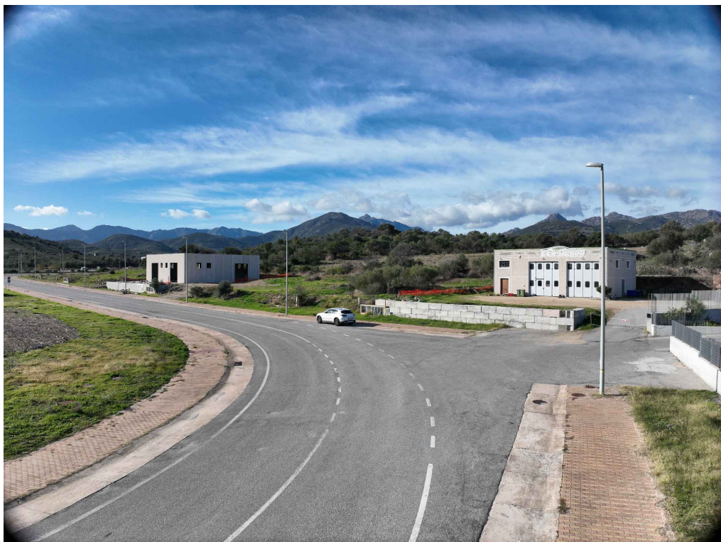
02 - Inquadratura telecamera