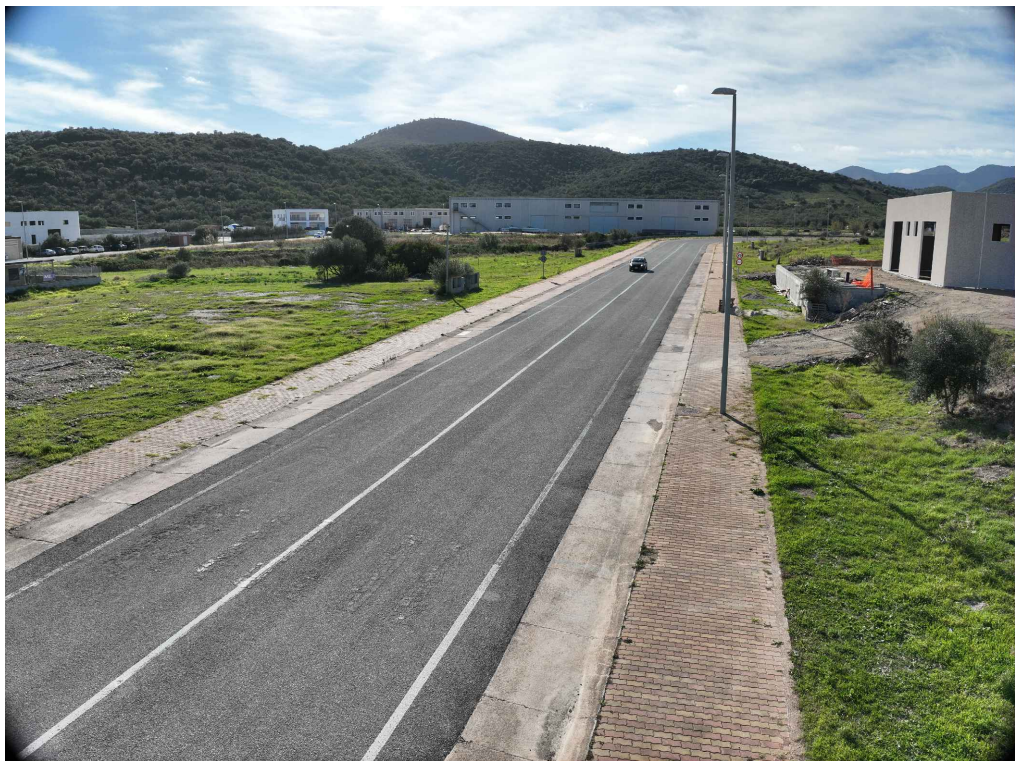
03 - Inquadratura telecamera