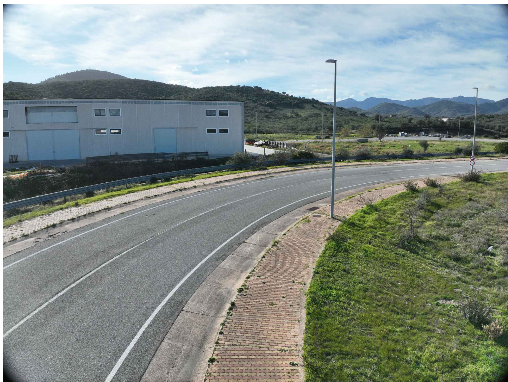
05 - Inquadratura telecamera