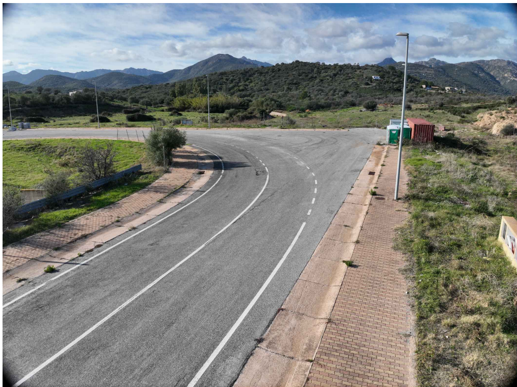
06 - Inquadratura telecamera