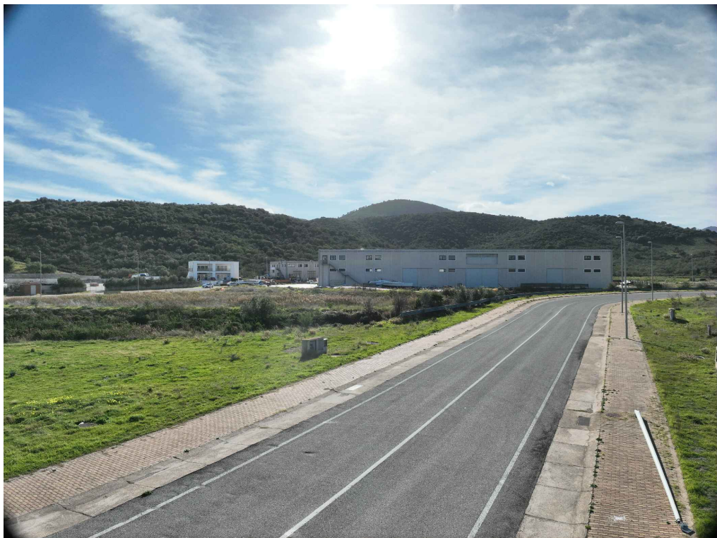
04 - Inquadratura telecamera