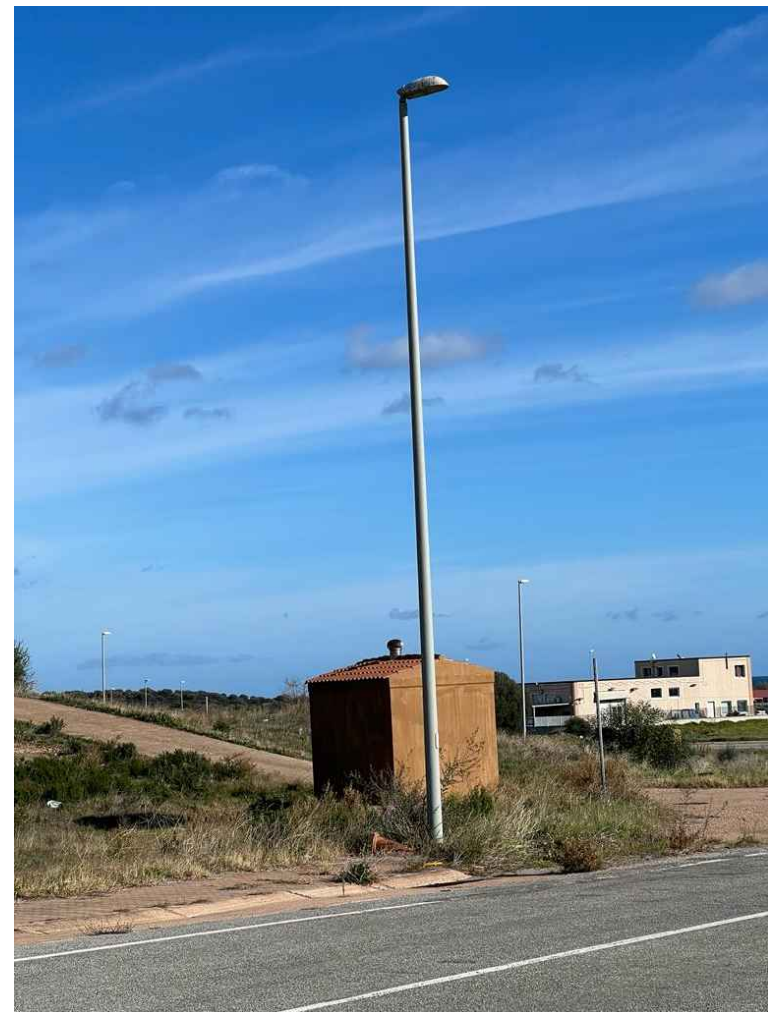
06 - posizionamento telecamera