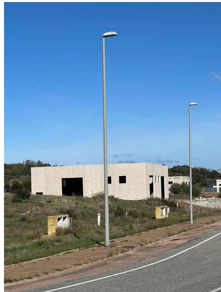
05 - posizionamento telecamera